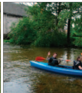
Ignalina - vandens pramo