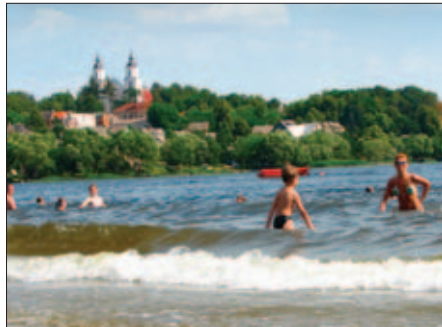
Zarasai - ežerais ir ramiu poilsiu