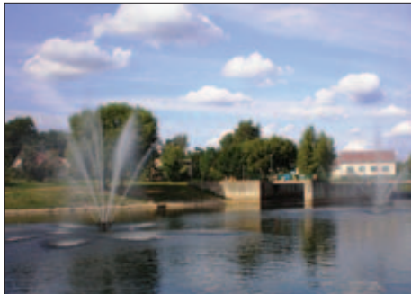
Anykščiai - kultūrinėmis ekskursijomis