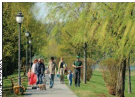
Birštonas - sanatorijomis ir poilsiu gamtoje