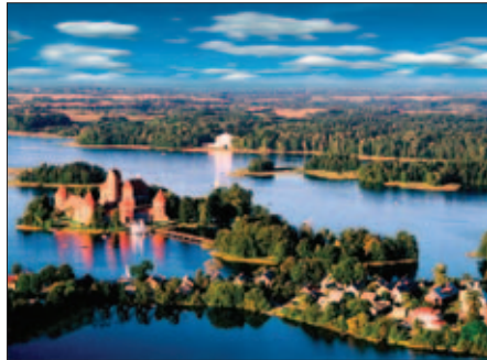
Trakai - pilimi ir ežerais