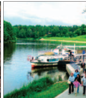
Druskininkai - sveikatinimo