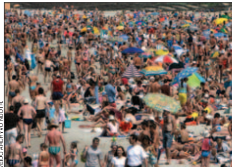
Palanga vilioja jūra ir renginiais