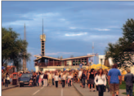
Neringa - unikalia gamta ir ramybe