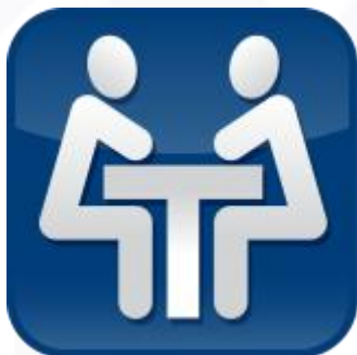
Pirkimai ir derybos