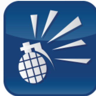
Kūrybiškumas ir verslumo ugdymas