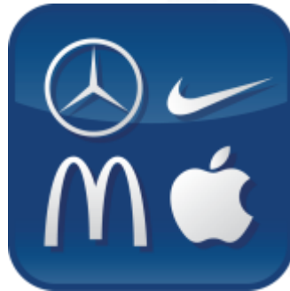
Marketingo konsultacijos ir rinkos tyrimai