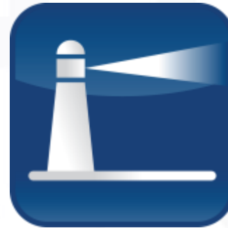
Personalo mokymai ir konsultacijos