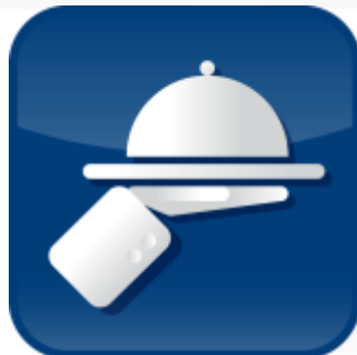
Pardavimai ir klientų aptarnavimas