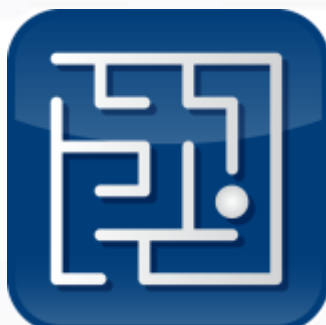
Psichologija ir koučingas