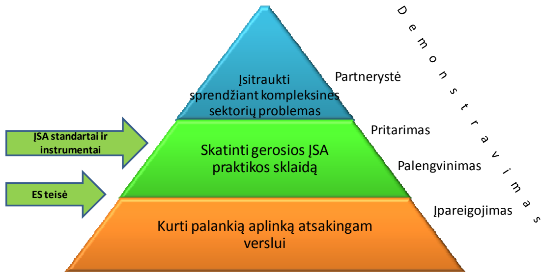
Pav. 2. Vyriausybės vaidmenys ir rolės plėtojant JSA

Keturi galimi pagrindiniai vyriausybės, valstybės institucijų vaidmenys plėtojant JSA (Fox, Ward, Howard 2002):