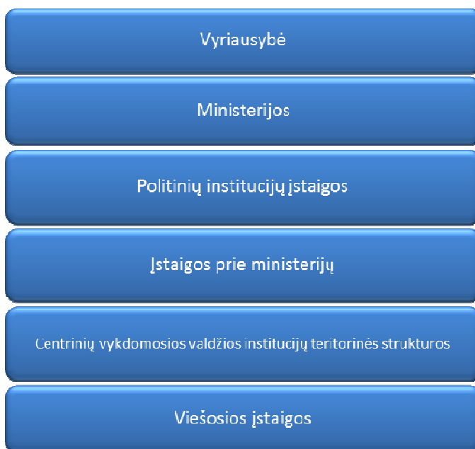
Pav. 1. Vykdomosios valdžios institucijų sistemos struktūra.

Galimybių studijos objektas – Lietuvos valstybės institucijos. Valstybės institucijų sistemą sudaro visuma valstybės institucijų, kurios yra glaudžiai tarpusavyje susijusios. Jos viena kitą papildo, kontroliuoja, padeda viena kitai įgyvendinti valstybės funkcijas. Šių institucijų klasifikavimas – sąlyginis dalykas. Pagal atliekamas funkcijas skiriamos įstatymų leidžiamosios, įstatymų vykdomosios ir teisėsaugos institucijos. Valdžios institucijų tarpe išskiriamos vykdomosios valdžios institucijos. Vykdomosios valdžios institucijos – tai valdžios institucijų rūšis, kurių paskirtis – vykdomosios valdžios įgyvendinimas, siekiant įgyvendinti įstatymus ir kitus teisės aktus ekonominėje, socialinėje kultūrinėje, politinėje-administracinėje veiklos sferoje. Žemiau pateikiama vykdomosios valdžios institucijų sistemos struktūra (pav. Nr.1).